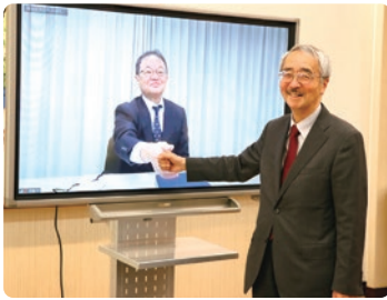
*1 大学コンソーシアム市川産官学連携プラットフォーム

2021年1月、当社市進ホールディングスは「大学コンソーシアム市川産官学連携プラットフォーム *1 」と包括協定を締結しました。市川市の施策推進及び課題解決、地域産業の発展・振興、地域活性化や地域課題解決等に資する学生の教育・育成・学生のキャリア支援等について双方が連携し、取り組みを進めていきます。